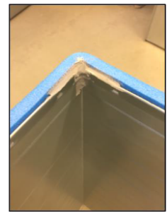
Kittning av hörn forts.