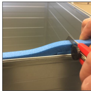
Packning kapsas med kniv