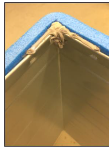
Kittning av hörn